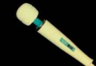
Hitachi Magic Wand c.1970s