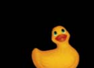
I Rub My Duckie® c.Present