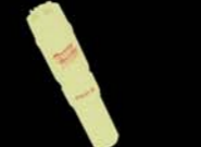
Pocket Rocket c.1990s