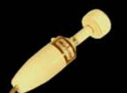
The "Fighter" c.1970